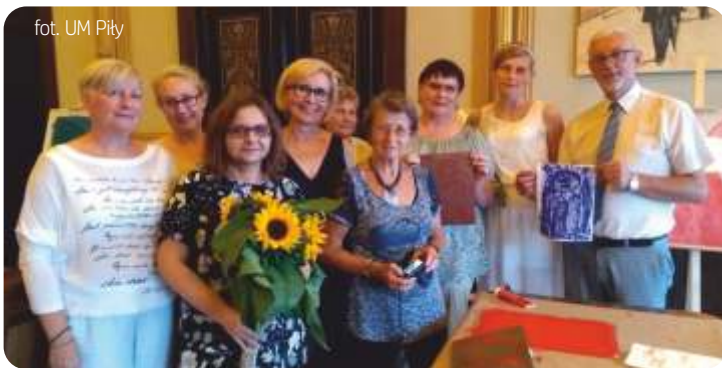
fol. UM Piły