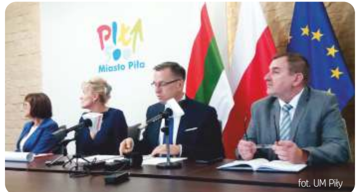
fol. UM Piła

siedzeniami, osłonami przed wiatrem i deszczem i antyoblodzeniową nawierzchnią