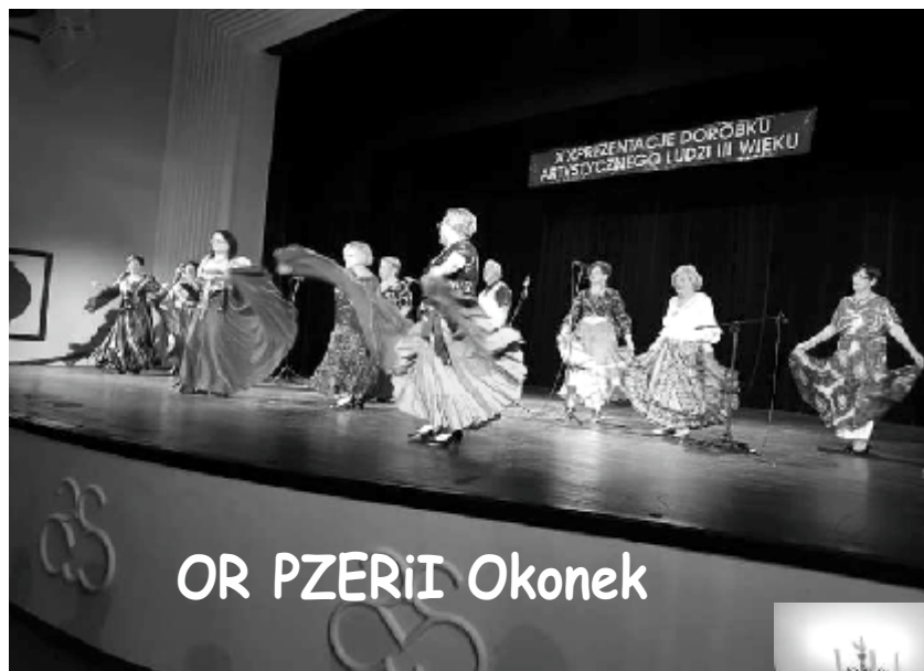
OR PZERiI Okonek