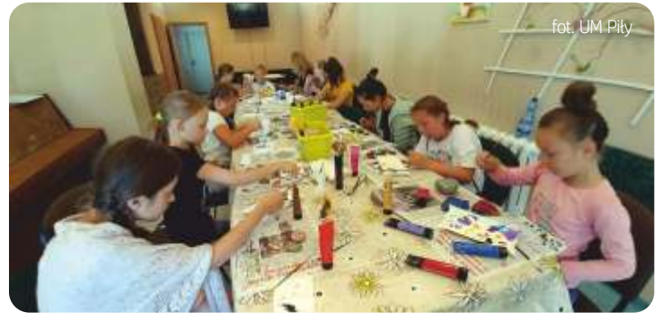
fol. UM Piły

Wycieczką do Unieścia pożegnali lato pilanie skupieni wokół Klubu Seniora RCK. Był spacer po plaży, piknik oraz zawody i konkursy, wśród których największym powodzeniem cieszyły się: tańca i na najciekawsze przebranie. Wyjazd był podsumowaniem pracowitego lata, podczas którego członkowie Klubu Seniora RCK przeprowadzili cykl zajęć rękodzielniczych. W ramach akcji „Lato u Seniora” młodzi pilanie uczyli się: artystycznego malowania kamieni, wykonywania ekologicznych bransolet z różnych materiałów, ozdób z agrafek, zdobienia toreb oraz szycia wakacyjnych poduszek.